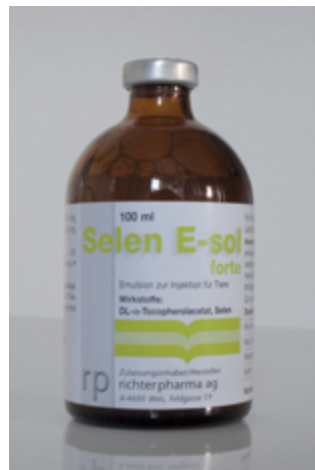
Abb. 5: Selen E-sol®-Arzneimittel – enthält Vitamin E und Selen

Das Injektionspräparat Selen E-Sol® (rechts, Abb. 5) ist ein Arzneimittel, während das über das Maul zu verabreichende Präparat Chevivit E-Selen® (links, Abb. 4)