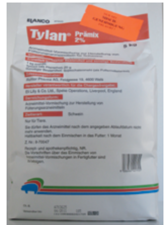
Abb. 7: Tylan – Arzneimittel mit Antibiotika