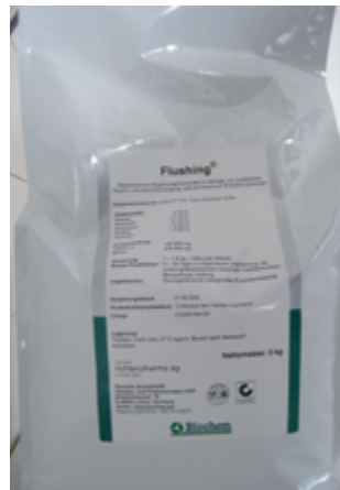
Abb. 6: Flushing – Ergänzungsfuttermittel

zwar ebenfalls Vitamin E und Selen als Wirksubstanzen enthält, aber als biotaugliches Futtermittel eingestuft ist.