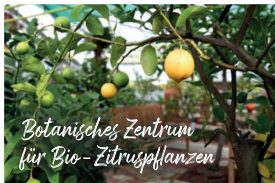
Botanisches Zentrum für Bio-Zitruspflanzen