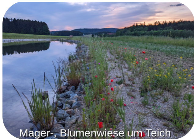
Mager-, Blumenwiese um Teich