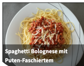
Spaghetti Bolognese mit Puten-Faschiertem