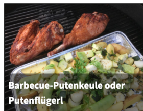
Barbecue-Putenkeule oder Putenflügel