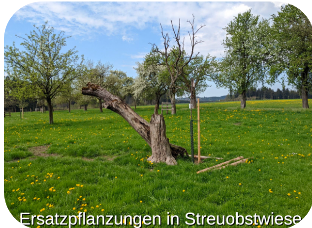
Ersatzpflanzungen in Streuobstwiese