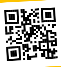
4 Biohof Kneringer